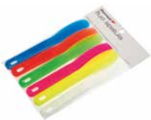
Флуоресцентные шпатели для альгинатов (6 штук)