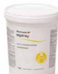
Algitrax 1 кг

Узнайте больше о других продуктах Zhermack, имеющих отношение к предварительному оттиску