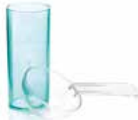
Набор мерников для 48-часовых альгинатов