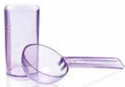
Набор мерников для 5-дневных альгинатов