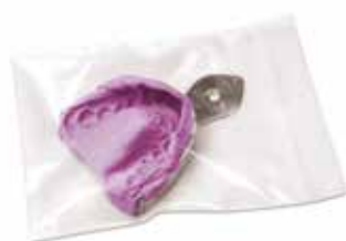
Пакет «Long Life», упаковка содержит 100 штук (герметично закрывающиеся пакеты для хранения оттисков)